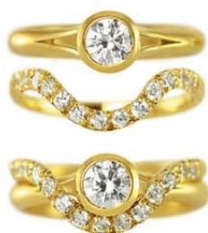
Hiding Heart og Hooked on You ringe.

”Mit arbejde handler rigtig meget om at lytte – også til alt det, der ikke bliver sagt. Det er nemlig her, det spændende opstår. Når jeg laver vielsesringe, skal jeg forstå begges ønsker og forene dem i et sæt vielsesringe. Nogle gange ender mine kunder med noget, de ikke engang vidste, de ønskede sig, fordi deres kreativitet får lov at blomstre i processen.”